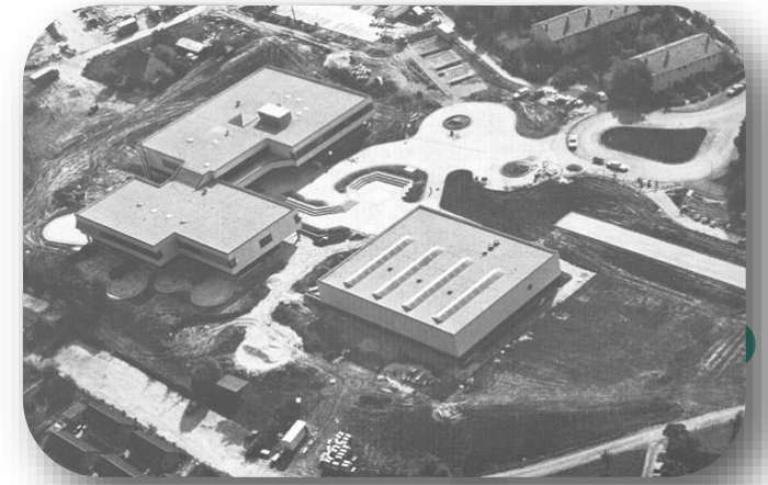
1977 | Schulgebäude an der Achalm