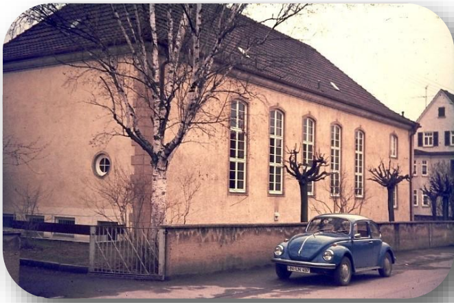
1973 | Start in Betzingen