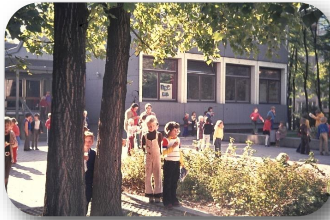
1974- 1977 | Kath. Augustin-Bea-Haus RT